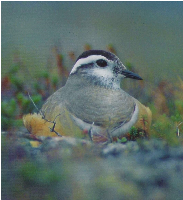
Mornellregenpfeifer am Brutplatz